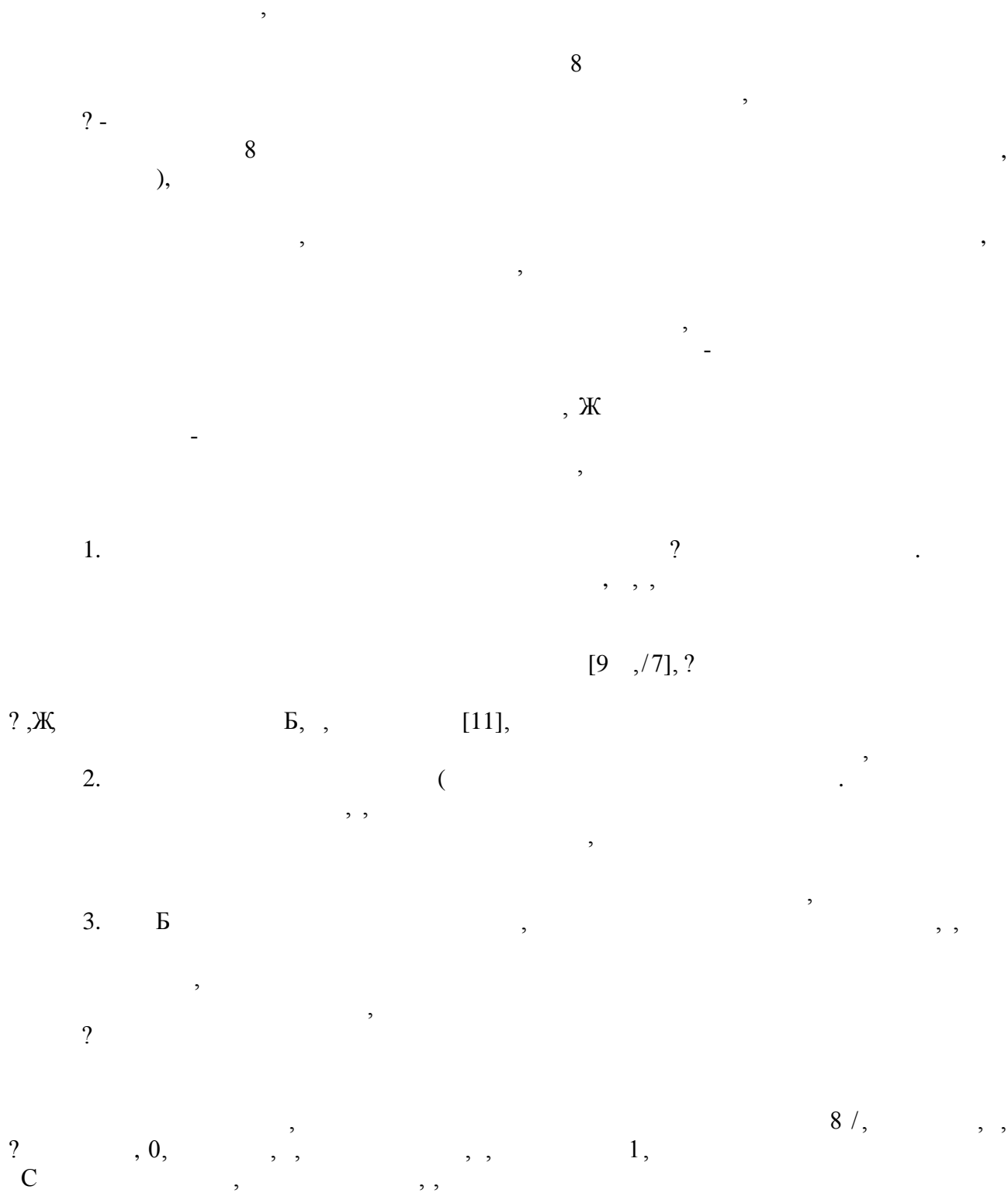
Схема Л.С. Выготского